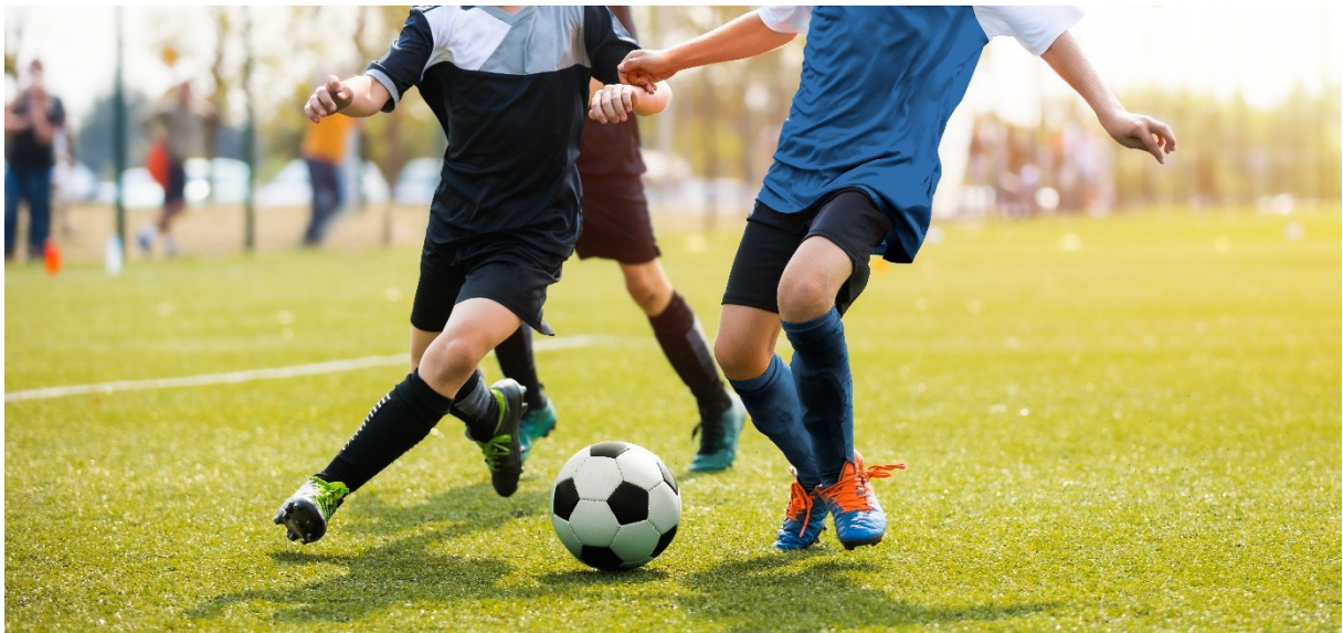
футбол (czytaj: futbol)