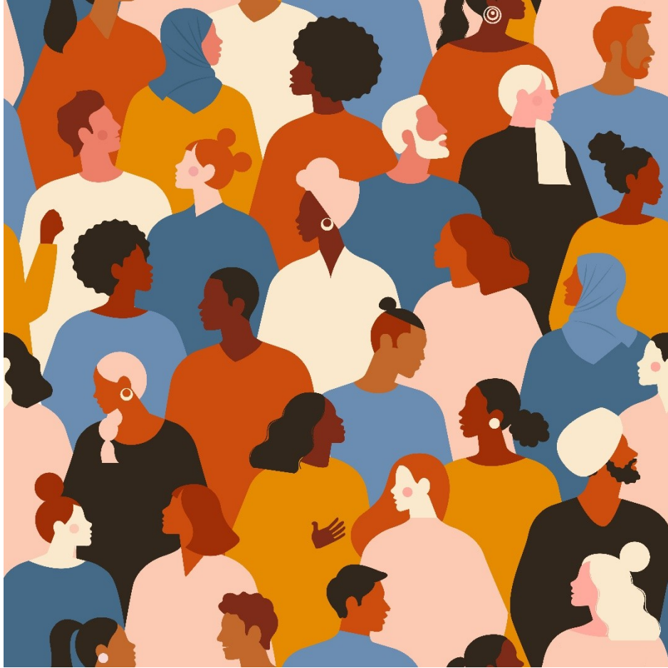
Люди (czytaj: Lyudy)