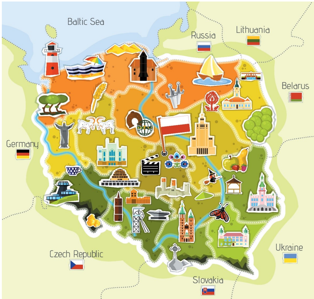
Польша (czytaj: Pol'shcha)