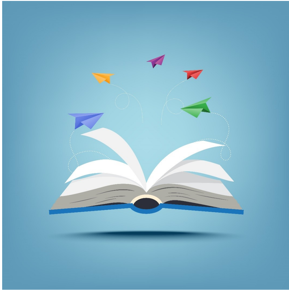
КНИГИ (czytaj: knyhy)