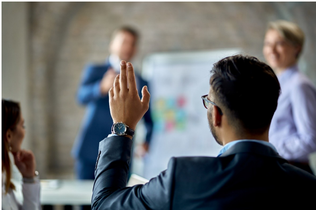
Запитання (czytaj: zapytannya)