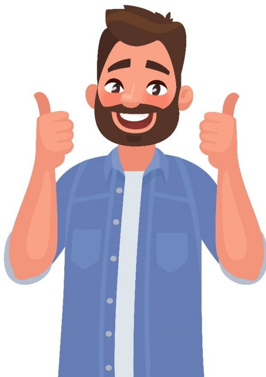
мені подобається (czytaj:meni podobayet'sya)