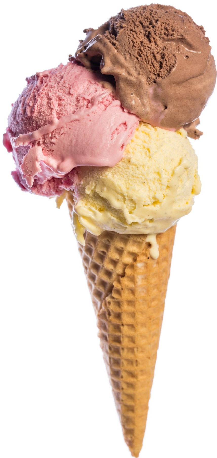
МОРОЗИВО (czytaj: morozywo)