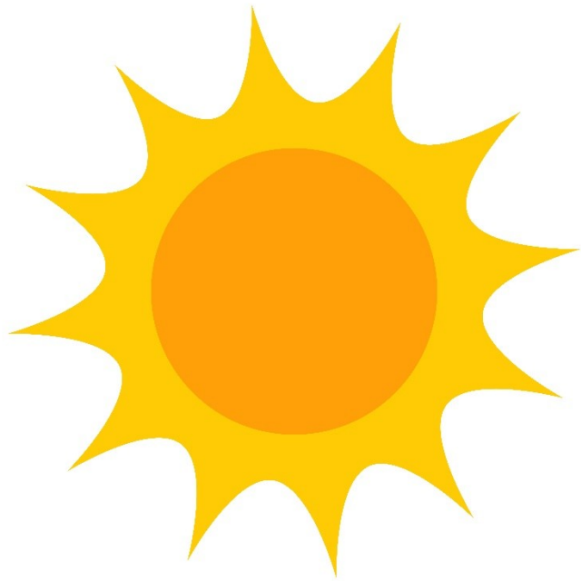
СОНЦЕ (czytaj: sontse)