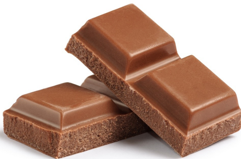
ШОКОЛАД (czytaj: shokolad)