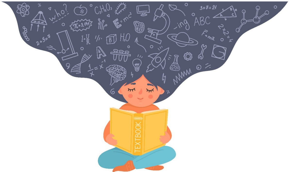
НАВЧАТИ (czytaj: navchaty)