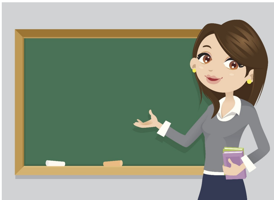
пані (czytaj: pani)